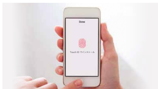
App Store でアプリ購入時に Touch ID による指紋認証

スマホで iPhone を使用している人はたくさんいらっしゃると思います。特に国内では海外とくらべ iPhone のシェアが高いので皆さんの周りにもたくさんの方が iPhone を使用しているのではないのでしょうか。iPhone を初めて使用するときには必ず最初に Apple ID の登録が必要になります。これは自分のメールアドレスと自分で指定したパスワードで作成されます。また、最近の iPhone ではロックした iPhone にアクセスするのに Touch ID と呼ばれる指紋情報で認証することができます。iPhone ではさまざまなサービスを利用するのに Apple ID が使用されます。App Store の設定の中でも Apple ID とパスワードを覚えておいてくれます。