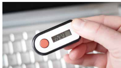
ネット送金ができるオンラインバンキング ID パスワードとトークンに表示される番号を入力

オンラインバンキングを活用している人の中には、銀行からトークンと呼ばれる小さなキーホルダーみたいなガジェットが送付されてきて使用している人もいるのではないのでしょうか。このトークンには小さな液晶があり表示されている数字が常に定期的に更新されています。オンラインバンキングのシステムにログインするときに自分の ID とパスワードを入力し、そのあとトークンに表示されている番号を入力してログインできるようになります。このトークンの定期的に変わる数字列は「ワンタイムパスワード」と呼ばれ入力しているときにハッカーに知られてしまっても、次にログインするときにはその時にトークンに表示されている数字列でないとログインできないため安全であると言えます。