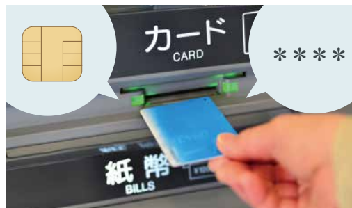
IC チップキャッシュカードと暗証番号

みなさんが銀行の ATM に行って預金を引き出す時のことを考えてください。キャッシュカードを使いますね。最近のキャッシュカードには IC 対応のキャッシュカードが普及しています。このキャッシュカードに IC チップが埋め込まれています。この IC チップは偽造が非常に困難な物理的な仕組みが施されています。預金を引き出す時にこの IC 対応キャッシュカードを ATM に挿入し、事前に登録している暗証番号を入力します。これは IC 対応キャッシュカードを持っていること、暗証番号を知っていることの二つの要素で認証しているので多要素認証の一つです。